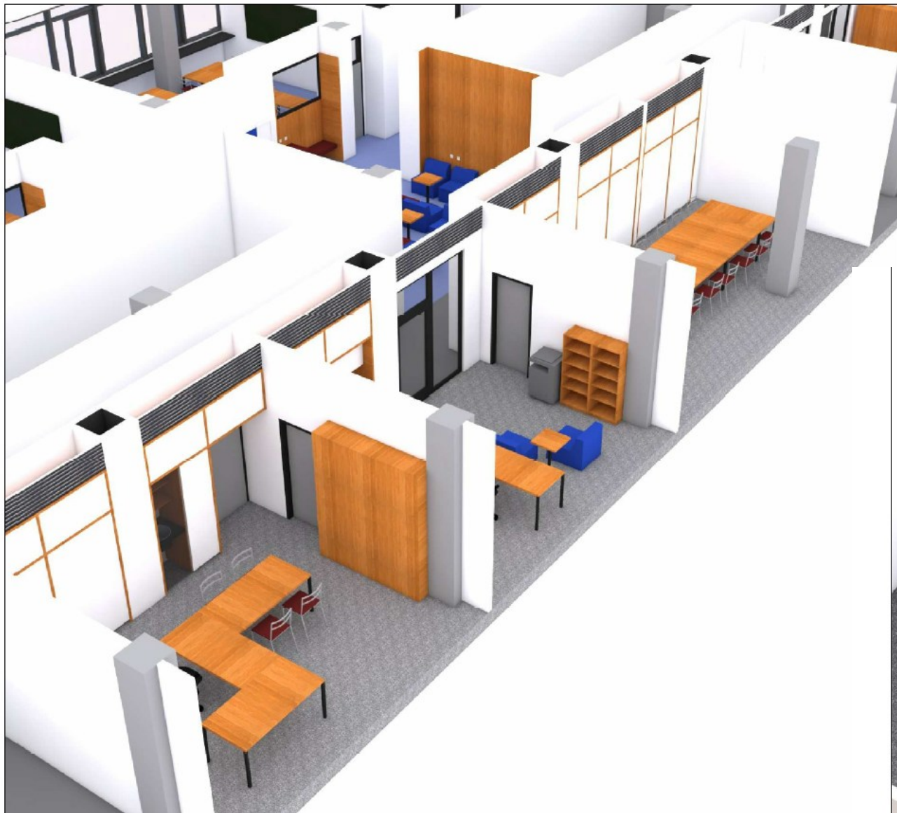
Vizualizace návrhů místností prezentovaných ve studii