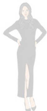
Black tie optional