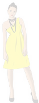
Creative black tie